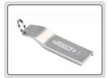
16G U盘 (标配)